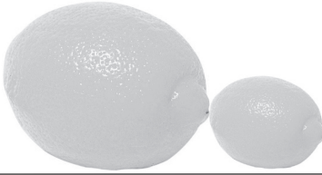
اعداد: فاطمة الحسني